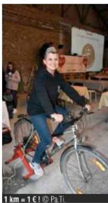
1 km = 1 € !

terminer les 4 et 5 avril prochain avec à la clef un nouveau record du monde de claquettes et six mois de salaire financés pour un chercheur du Télévie ». Et du monde, il y en avait ce samedi à Givry. Pas moins de 180 personnes étaient présentes pour cette première activité. Il s'agissait d'un blind test: les participants devant reconnaître des chansons en tous genres, tous styles, et de toutes les époques, de Charles Trenet à Angèle. Les six équipes s'affrontaient bien évidemment, il régnait une chouette ambiance, très détendue avec pas mal de participants qui pour la circonstance s'étaient déguisés. Le but de la soirée était donc de récolter 6.000 euros. Pas évident