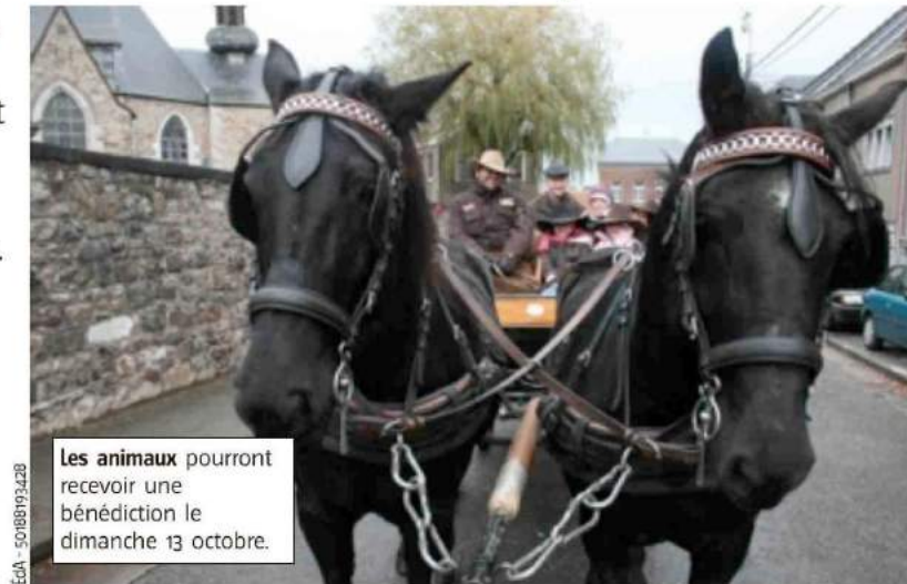
Les animaux pourront recevoir une bénédiction le dimanche 13 octobre.

Lieu d'accueil pour la balade et du souper Bingo : la salle Chez Nous, rue du Manoir à Agimont. Inscrip-