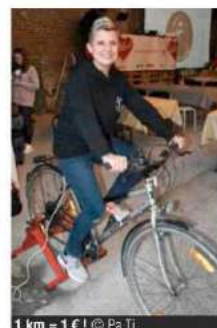
1 km = 1 € !

> 14 mars : green day et bal des enfants.