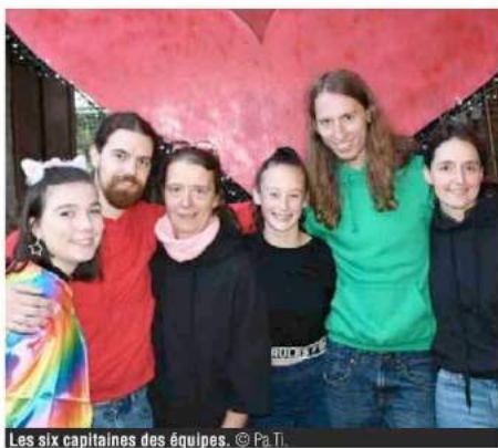
Les six capitaines des équipes.

Ce samedi, la soirée a été animée à la halle aux grains à Givry où le collectif « Tous en scène » organisait un blind test pour lancer l'opération « Six point six ». Tous en scène, c'est une formidable association qui met sur pied des cours de claquettes pour tous les âges mais aussi des animations qui créent une belle ambiance dans le village de Givry. A plusieurs reprises, le collectif a réussi des marathons de 24 heures de claquettes. « L'objectif de cette opération », nous confiait Isabelle Sirjacobs, coordinatrice des activités, « est de récolter 36.000 euros pour la recherche pour le Télévie. Le principe est simple: six mois, six équipes, 6.000 euros par équipe, 6 événements majeurs, 6x6 heures de claquettes pour