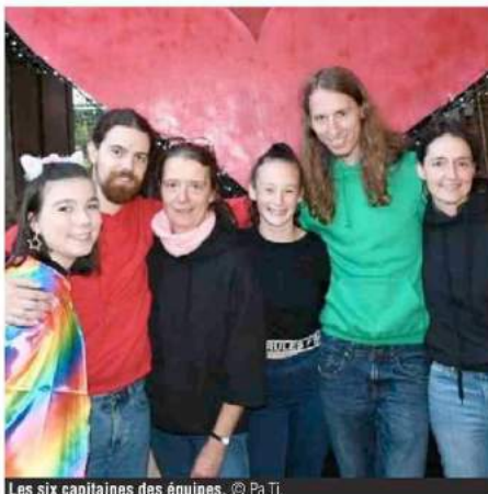
Les six capitaines des équipes.

Et du monde, il y en avait ce samedi à Givry. Pas moins de 180 personnes étaient présentes