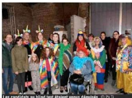
Les candidats au blind test étaient venus déguisés.

styles, et de toutes les époques, de Charles Trenet à Angèle. Les six équipes s'affrontaient bien