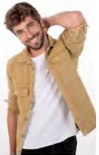
Agustín Galiana est le parrain de cette édition du Télévie, un peu spéciale.

La soirée du 19 septembre verra également défiler des artistes impliqués : Loïc Nottet, Salvatore Adamo, Kendji Girac ainsi que Fanny Leeb, la fille de Michel Leeb (1 er parrain du Télévie), chanteuse et qui a elle-même dû se battre contre un cancer du sein. ■