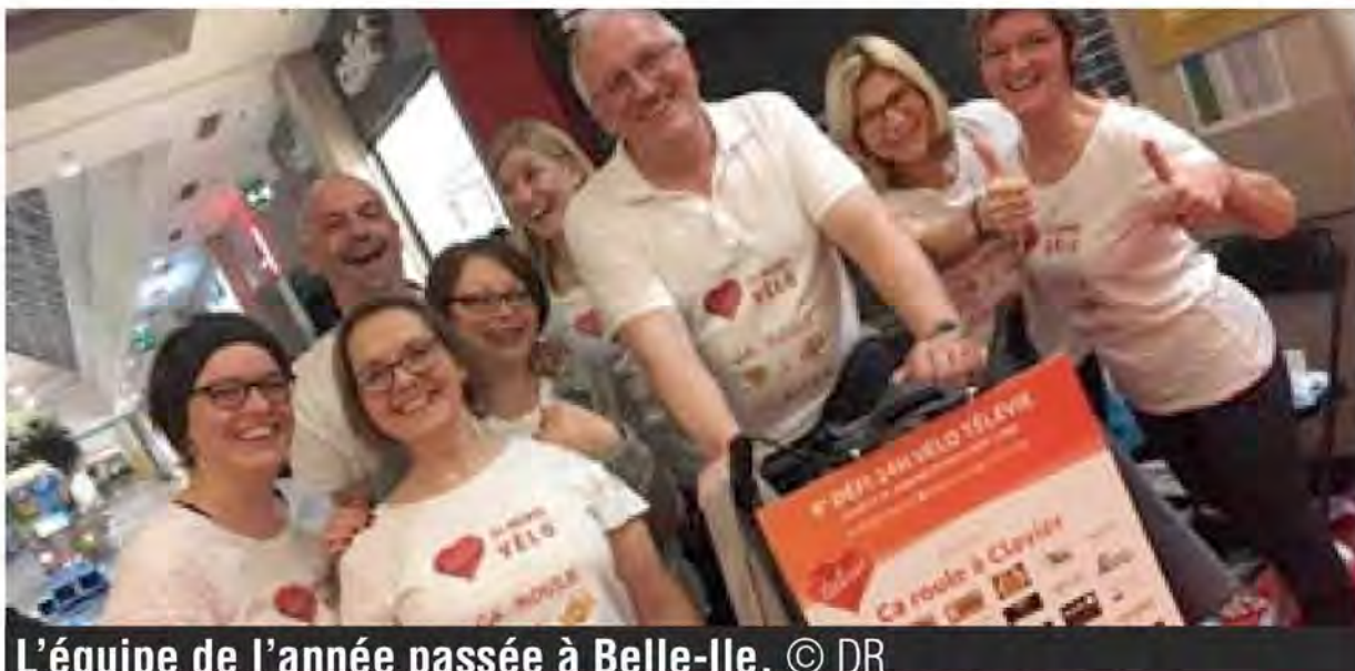
L'équipe de l'année passée à Belle-Ile.

Comme l'année dernière, la commune de Clavier s'est portée candidate pour les 24 heures vélo du Télévie organisées par le CHU et l'Université de Liège afin de récolter des fonds pour soutenir la recherche contre le cancer. Différents membres du personnel communal et du CPAS, ainsi que des mandataires, étaient prêts à relever le défi. Malheureusement, l'événement initialement prévu les 19 et 20 mars a été reporté à deux reprises avant d'être annulé à cause des mesures sanitaires imposées. Quoiqu'il en soit, les deux