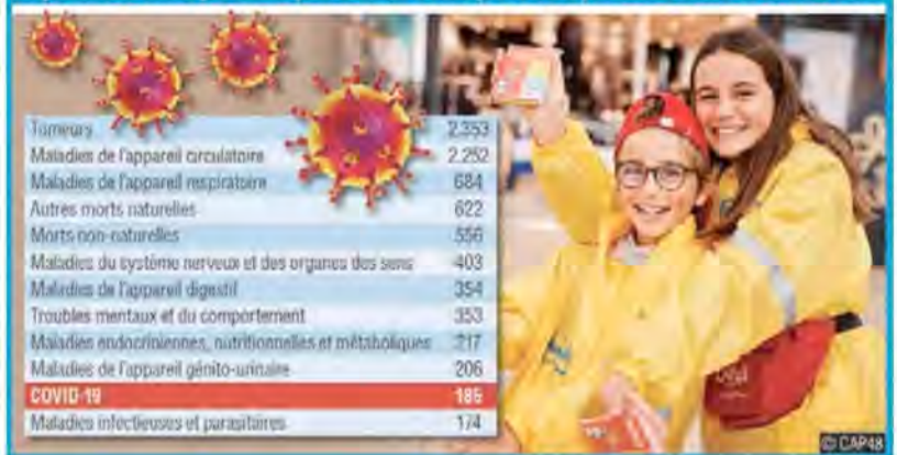
Moyenne des décès par cause pour le mois d'août (2010-2017) vs décès Covid-19 en août 2020

L'an dernier, plus de treize millions avaient été récoltés par le Télévie pour aider le FNRS dans sa lutte contre le cancer. « Plusieurs événements propres à RTL-TVI ont, eux aussi, été annulés. Je pense à la soirée de gala, à la pièce de théâtre qui a été in-