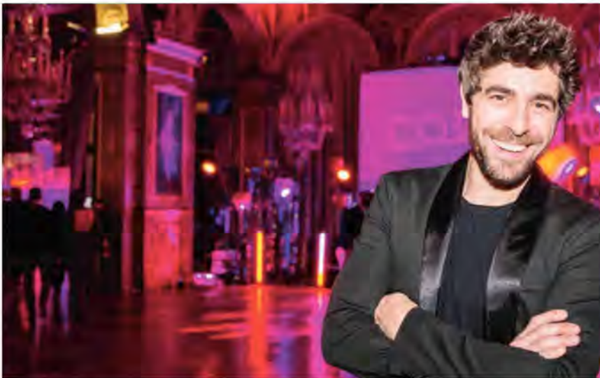
Agustin Galiana a souvent participé à la grande soirée du Télévie en tant qu'artiste invité.