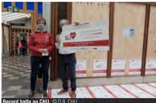
Record battu au CHU.

C e vendredi à 17 h se terminaient les 24 heures vélo du Télévie organisées par le CHU et l'ULiège. 134 vélos, près de 6.000 cyclistes, ont participé à cette édition rendue délicate par le coronavirus