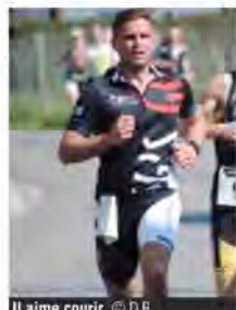
Il aime courir.