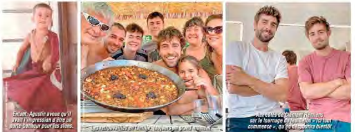
Enfant, Agustin avoue qu'il avait l'impression d'être un porte-bonheur pour les siens.

Agustin Galiana sera en concert le 31 octobre au Trocadéro de Lille et le 1 er novembre à la Madeleine à Bruxelles. Infos : ticketsmaster.be