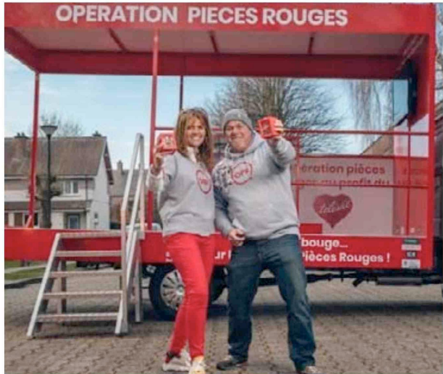
La tournée des Pièces Rouges s'arrêtera à Hannut en mars.

mise à l'équipe de la matinale de Bel-RTL lors de la seconde quinzaine de mars.